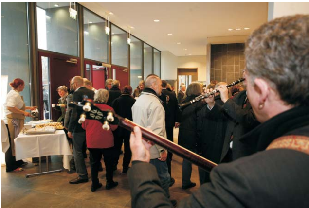
Eröffnungsfeier mit Musik am 10. November 2011.

Im Bestattungsforum und auch auf dem Friedhof treffen sich Menschen, die in der Regel einen Trauerfall erlebt haben. Sie können dort über ihre Erfahrungen sprechen. Wichtig sind die Begegnung miteinander und der Austausch untereinander. Dies ist wohltuend, gerade an diesem Ort. Das Zurückfinden ins Leben ist das Ziel der Trauerarbeit und gibt dem Trauernden die Lebensperspektive zurück. Neben den privaten Möglichkeiten eines Treffens gibt es Vorträge und Informationsveranstaltungen, die diesen Prozess unterstützend begleiten.