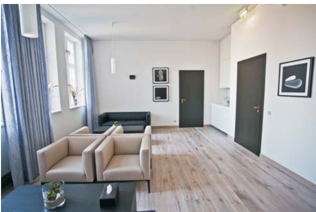
Sie geben Ruhe vor der Trauerfeier: die Familienräume. Hier der großzügige Familienraum der Fritz-Schumacher-Halle.

Spezielle Räume für Familien erweitern das Angebot zur Begleitung des Verstorbenen auf seinem letzten Weg.