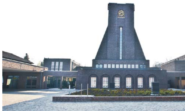
Unter dem Pflanzbeet befindet sich die Filtertechnik, links die Verstorbenaufnahme.

Mit ansprechenden Abschieds- und Feierräumen, dem Café Fritz, einem Kolumbarium für oberirdische Urnenbeisetzungen und einer zeitgemäßen Feuerbestattungsanlage wird der weltgrößte Parkfriedhof Ohlsdorf durch das Bestattungsforum weiter aufgewertet.