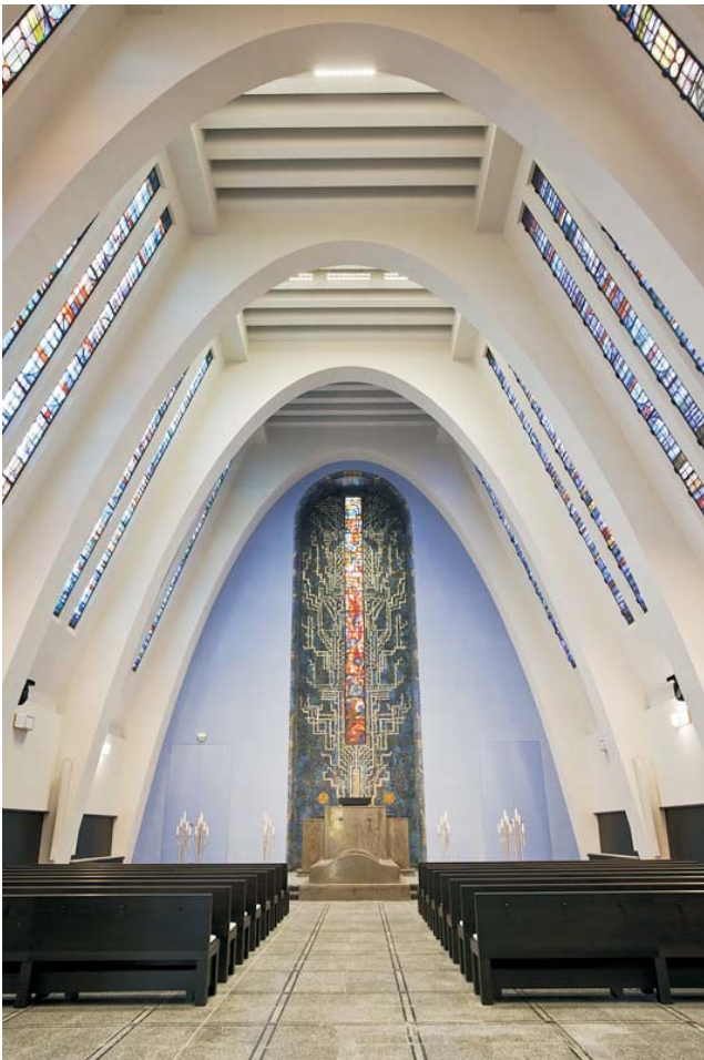
Besonders eindrucksvoll: die Fritz-Schumacher-Halle.

Spezielle Räume für Familien erweitern das Angebot zur Begleitung des Verstorbenen auf seinem letzten Weg.