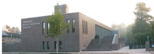
Erschließung des Forums von Westen durch eine breite Freitreppe. Der Zugang auf den Friedhof wurde wieder hergestellt.

Zusätzlich entstanden westlich zwei Anschlussbauten, die sich mit dem historischen Bau zu einem harmonischen Ganzen fügen, wobei alle Neubauten sich dem denkmalwürdigen Altbaubestand unterordnen. Der Nordflügel tritt aufgrund seiner eingeschossigen Bauweise in der Flucht des Schumacherbaus im öffentlichen Raum nicht in Erscheinung. Er geht in den überdachten Außenbereich der Verstorbenaufnahme über. Der Südflügel des Neubaus, in dem auf zwei Ebenen die öffentlichen Nutzungen des Bestattungsforums untergebracht sind, nimmt die Vorderkante der Treppenanlage des Schumacherbaus auf.