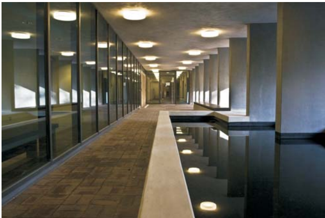
Im Neubau, hier der Außenbereich vor den Abschiedsräumen, herrscht eine geradlinige Formensprache.

Darüber hinaus setzt sich die anspruchsvolle Architektur auch in den Bereichen fort, die den Bestattern bzw. ausschließlich den Mitarbeiterinnen und Mitarbeitern im Bestattungsforum zugänglich sind.