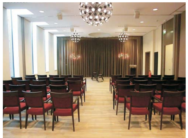
Die Cordeshalle im Bestattungsforum.

der Trauerarbeit. Sie speisen sich aus den überlieferten Traditionen des Abschieds und umfassen eine klassische Trauerfeier, auf Wunsch die Feuerbestattung, Beisetzung auf dem Friedhof und einen Leichenschmaus. Sie dienen dazu, dass die Gemeinschaft, aus der ein Mensch gerissen wurde, sich an ihn erinnert und ihn ehrt.