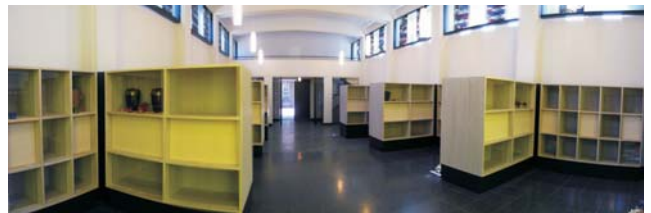
Das Kolumbarium im Bestattungsforum.

Räume für Ruhe und Trost sind die im Bestattungsforum verfügbaren zwei Begräbnisstätten: Das Kolumbarium und die Urnenkrypta für oberirdische Urnenbeisetzungen. Hier können Besucherinnen und Besucher verweilen, Blumenschmuck ablegen und eine Kerze zum Gedenken entzünden.