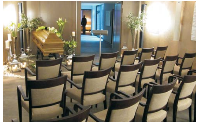
Die Linnehalle erlaubt die Begleitung des Sarges durch die Angehörigen bis zur Einäscherungsanlage (im Hintergrund).

Rituale sind seit langen Zeiten geübte und bewährte Formen des Gedenkens und Erinnerns und helfen bei