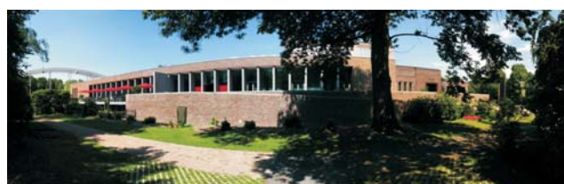
Der Neubau harmoniert mit seiner Umgebung (Blick von Süden).

Großen Wert wurde auf die barrierefreie Zugänglichkeit aller öffentlichen Bereiche gelegt. Dazu dienen eine Rampe an der Südfassade, breite Außentüren und die Aufzugstechnik im Eingangsbereich.