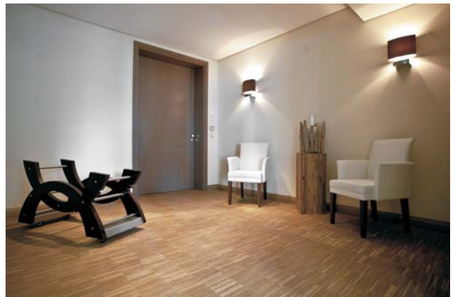
Ein klimatisierter Abschiedsraum für einen individuellen Abschied.

Die wichtigsten Augenblicke einer gemeinsamen Zeit noch einmal aufleben lassen – das ist möglich in den Abschiedsräumen des Bestattungsforums. Ungestört und ohne Zeitdruck können Trauernde bei einem Verstorbenen verweilen - bis hin zur klassischen Totenwache. Ganz für sich oder mit anderen Besuchern. Die Angehörigen erhalten daher Zugang zu den vier Abschiedsräumen im Untergeschoss ohne zeitliche Einschränkungen.