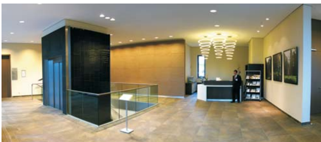
Das Foyer zeigt sich mit warmen, angenehmen Farben und hochwertigen Materialien.

Alle Einbauten sind ebenfalls mit Eichenfurnieren gestaltet. Die Polsterung der Möbel setzt Farbakzente. Die Trauerfeerräume erhalten grüne Stoffe, die Gastronomie Rote.