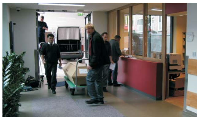
Die Verstorbenaufnahme. Die hochwertige Architektur setzt sich auch in den nichtöffentlichen Bereichen fort.

Das historische Krematorium des Hamburger Oberbaudirektors Fritz Schumacher erstrahlt in neuem Glanz. Besonders bemerkenswert ist, dass die Einäscherungsanlage in das vorhandene Gebäude integriert werden konnte. Das Schumacher-Krematorium, oder wie es künftig auch heißen wird, das Ohlsdorfer Krematorium, dient jetzt wieder seinem ursprünglichen Zweck. Damit ist für die Feuerbestattung in Hamburg ein würdiger Raum geschaffen.