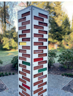
Grabanlage „Farben der Erinnerung“

Die Anlagen mit ihrem begleitenden Blütenflor werden jeweils von den Ohlsdorfer Friedhofsgärtnereien durch die Jahreszeiten verlässlich gepflegt.